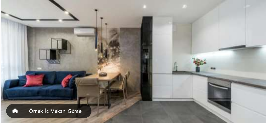
Örnek İç Mekan Görseli